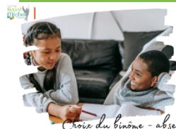
Choix du binôme - absence

Les élèves de collège font peu à peu connaissance avec leurs camarades de classe ou les connaissent déjà fort bien. Chacun d'eux est invité à choisir le binôme qui sera chargé de prendre ses devoirs en cas d'absence.