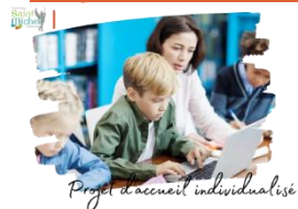
Projet d'accueil individualisé

Les élèves atteints de troubles de la santé qui évoluent sur une longue période et/ou qui peuvent donner lieu à des aménagements au quotidien, et/ou pour les examens, doivent faire l'objet d'un P.A.I.