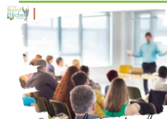
Réunion d'information de rentrée

La réunion d'information de rentrée 5° / 4° se déroulera le jeudi 21 septembre 2023 à partir de 18h15 . Les parents seront accueillis dans la cour collège par le professeur principal de leur enfant. Ce jour-là des informations diverses concernant la scolarité de leur enfant leur seront communiquées. Veuillez réserver cette date.