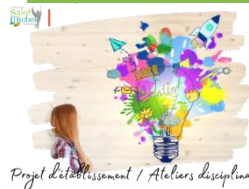
Projet d'établissement / Ateliers disciplinaires

Dans le cadre du projet d'établissement, les élèves de collège participeront à des ateliers qui se dérouleront le mardi de 15h45 à 17h15 .