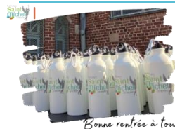
Bonne rentrée à tous !

Pour démarrer l'année scolaire 2023 / 2024 avec de bonnes résolutions, l'A.P.E.L. Saint Michel a souhaité contribuer, comme l'an dernier, à la protection de notre planète et donc à notre bien-être à tous tout en faisant plaisir à vos enfants.