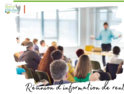
Réunion d'information de rentrée

La réunion d'information 6° se déroulera le mardi 12 septembre 2023 à partir de 18h15 . Les parents seront accueillis dans la cour collège par le professeur principal de leur enfant.