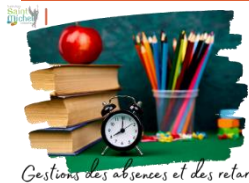
Gestions des absences et des retards

La saisie des absences se fait désormais de façon numérique. Les familles doivent informer l'établissement de l'absence de leur enfant en envoyant un mail via École Directe à l'interlocuteur ad hoc, à savoir M. VIE SCOLAIRE C. s'il s'agit d'un collégien et M. VIE SCOLAIRE L. s'il s'agit d'un lycéen . Le respect de cette consigne permettra d'éviter perte de temps et dysfonctionnements.