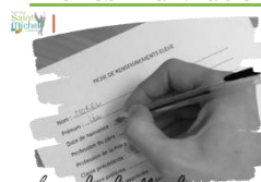
Fiches individuelles de renseignements

Une fiche individuelle de renseignements a été remise à chaque élève le mardi 05 septembre 2023 par le professeur principal.