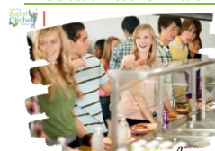
Restauration du mercredi

Les talons restauration du mercredi distribués cette semaine aux élèves de 4° et 3° internes ou demi-pensionnaires étaient à déposer à la vie scolaire collège ou à retourner par mail via École Directe pour ce vendredi 08 septembre 2023 .