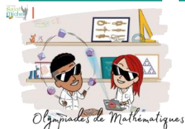
Olympiades de Mathématiques

Mercredi 11 octobre 2023 , les élèves de 1° spécialité maths, ont assisté à une présentation du concours « Olympiades de mathématiques ».