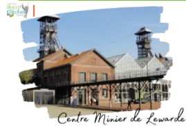
Centre Minier de Lewarde

Depuis le début de l'année, les élèves ont découvert la vie des femmes au XIX ème en lisant des textes de Maupassant ou de Zola. Le programme d'histoire étudiera également cette période dans le cadre du programme sur L'Europe au XIX ème siècle. Dans cette perspective d'un projet interdisciplinaire, le centre minier de Lewarde propose aux collégiens de découvrir l'univers de la mine à travers la visite guidée « sur les pas de Zola, la mine au XIX ème siècle » complétée par le spectacle Germinal l'intemporel de la compagnie Climax.