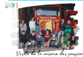
Visite de la caserne des pompiers