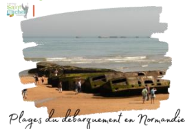
Plages du débarquement en Normandie

Le séjour en Normandie des 3 ° se déroulera du lundi 10 au mercredi 12 juin 2024. Le chèque de 100 euros déjà remis à Mme DUEZ ( pour rappel il est non-remboursable en cas de désistement ) sera prélevé à compter du vendredi 20 octobre 2023.