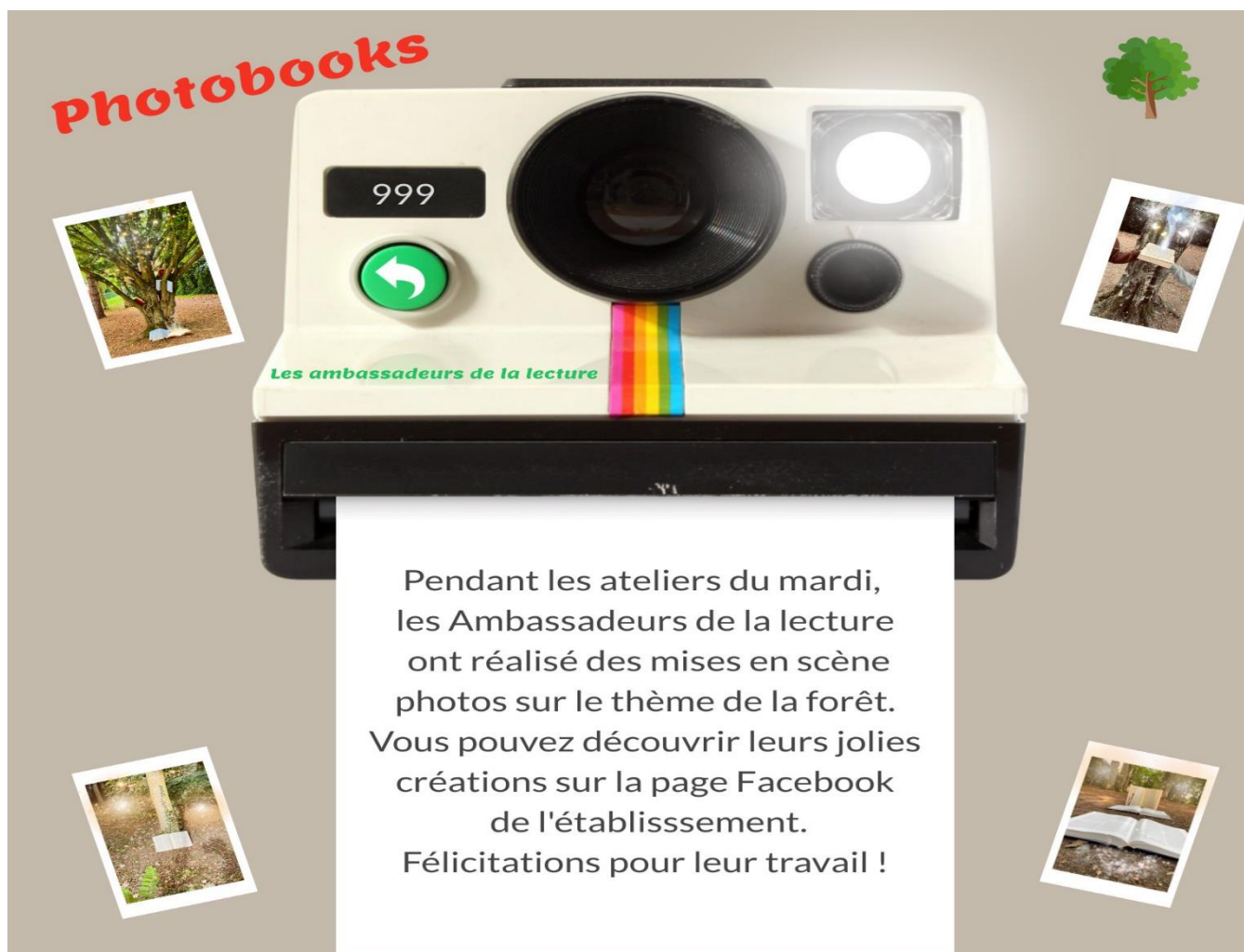
L. DESCAMPS, C. DE JÉSUS, professeures documentalistes