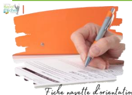
Fiche navette d'orientation

La fiche navette verte « orientation des élèves de 3° » a été distribuée aux élèves de 3° ce vendredi 15 décembre 2023 . Elle est à rendre au plus tard le lundi 08 janvier 2024 au bureau de l'adjointe de direction.