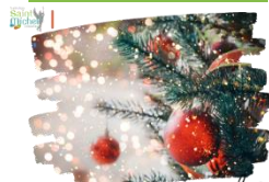
Vacances de Noël

Afin de permettre à chacun de profiter pleinement des vacances de Noël, il est demandé aux enseignants de ne pas donner de travaux écrits à faire durant cette période et de ne pas prévoir d'évaluation le jour de la rentrée. Par contre, les élèves devront connaître leurs leçons.