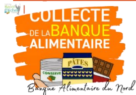
Banque Alimentaire du Nord

Défi inter-classes et inter-niveaux au collège pour la collecte en faveur de la Banque Alimentaire du Nord : fais gagner ta classe ou ton niveau en apportant des denrées non périssables dans les cartons situés :