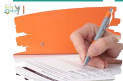
Fiche navette d'orientation

La fiche navette d'orientation a été distribuée par le professeur principal pendant l' heure de vie de classe du vendredi 08 décembre 2023. Cette fiche est essentielle dans l'acheminement du parcours d'orientation de votre enfant. Il est donc nécessaire de la compléter correctement.