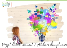
Projet d'établissement / Ateliers disciplinaires

Les groupes d'ateliers 3° ont été transmis aux élèves de 3° le jeudi 14 décembre 2023 via leur messagerie École Directe .