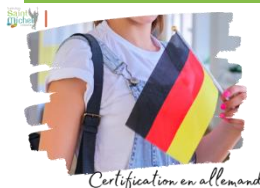
Certification en allemand

L'épreuve de certification en allemand du Goethe Institut pour les élèves de 3° aura lieu au collège Saint Michel le mercredi 13 mars 2024 de 08h30 à 12h00 pour les épreuves écrites et le jeudi 22 février 2024 pour l'épreuve orale de 15 mn.