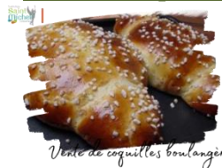
Vente de coquilles boulangères

L'Avent a commencé ! Le temps des chocolats chauds est revenu ! De manière à lever des fonds destinés à financer nos projets pastoraux, notamment la retraite « orientation-vocation » proposée en janvier 2024 aux 1° et T°, nous vous proposons une vente de délicieuses coquilles de Noël au prix de 5,50 euros/pièce.