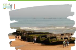
Plages du débarquement en Normandie

Nous vous informons que le 1 er chèque de 80 euros que vous avez remis à l'établissement sera encaissé à compter du mardi 19 décembre 2023.