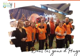
Dans les yeux d'Hugo

Ce samedi 09 décembre 2023 sur le marché de Noël de Solesmes, nous avons remis les piles récoltées à l'association dans les yeux d'Hugo .