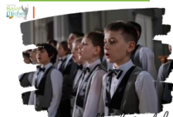
Veillée de Noël des 6 o

La traditionnelle veillée de Noël du niveau 6 o aura lieu le mardi 19 décembre 2023 à partir de 19h00.