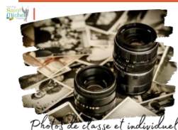
Photos de classe et individuelles