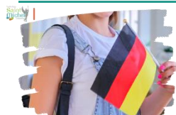
Certification en allemand

L'épreuve de la certification en allemand du Goethe Institut pour les élèves de 2 o aura lieu à Saint Michel le mercredi 13 mars 2024 de 08h30 à 12h00 pour les épreuves écrites et le lundi 19 février 2024 pour l'épreuve orale de 15 mn.