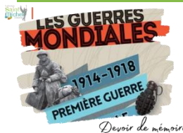
Devoir de mémoire

Une sortie au musée de Flandre de Cassel et à La Coupole d'Helfaut-Wizernes, un bunker de la Seconde Guerre mondiale, aujourd'hui centre d'histoire et de mémoire, situé dans la commune d'Helfaut, près de Saint-Omer est programmée le vendredi 24 mai 2024 (départ 08h40 et retour vers 18h30).