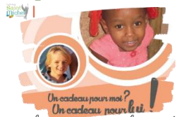
Un cadeau pour moi ? Un cadeau pour lui !

À tous ces enfants qui comptent sur nous, donnons confiance et espérance sur leur chemin de vie ! Leur offrir une année d'école, c'est vraiment leur faire un beau cadeau !