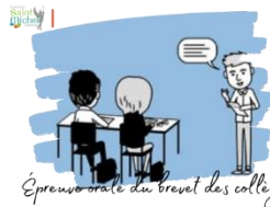
Épreuve orale du brevet des collèges

Des enseignants ont fait passer les oraux d'entraînement à l'épreuve orale du brevet des collèges ce mercredi 13 décembre 2023 . Ils ont ainsi eu l'occasion de leur prodiguer des conseils qui permettront à certains de perfectionner leur prestation, à d'autres d'avoir davantage confiance en eux et de moins stresser le jour J et enfin à certains, peu ou pas préparés, de se rendre compte qu'on ne peut pas improviser le jour de l'épreuve.