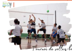
Tournoi de volley-ball

Afin d'aider l'option E.P.S. 1° / T° à financer de futurs projets, nous avons décidé d'organiser un tournoi de volley-ball qui se déroulera le mardi 13 février 2024 à partir de 17h30 et jusqu'à 20h30.