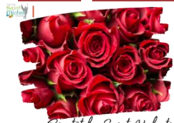
Bientôt la Saint-Valentin !

Dans l'optique de récolter des fonds afin de financer de nouveaux projets comme le bal de promo des T° , mais également dans le but de dynamiser le lycée ainsi que le collège , une vente de roses sera organisée, à l'occasion de la Saint Valentin, le vendredi 16 février 2024.