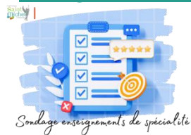
Sondage enseignements de spécialité

Le sondage concernant l'abandon de l'un des trois enseignements de spécialité actuellement suivis en classe de 1 o a été rendu aux élèves suite aux conseils de classe. Ce dernier comporte désormais les observations et recommandations du conseil de classe en lien avec le projet d'orientation post-bac de l'élève. Ce dernier est à rendre signé par les responsables légaux au professeur principal au plus tard le vendredi 09 février 2024 . Ce dernier sera remis en début de semaine prochaine aux élèves de 1 o B.