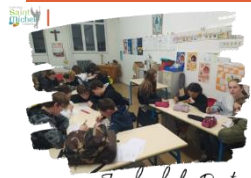
Judis de la Pastorale

Le jeudi 25 janvier 2024 , l'Église catholique a commémoré la Conversion de St Paul. Les internes se sont donc penchés sur la question lors du traditionnel « Judi de la Pastorale ». Après avoir visionné une vidéo relatant l'épisode, ils ont travaillé en petits groupes sur différents thèmes : les lettres, les voyages, la biographie de St Paul et échangé leurs trouvailles. Le témoignage d'une étudiante est venu conclure la séance et les a surpris : mais oui, une telle conversion est encore possible de nos jours !