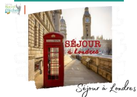
Séjour à Londres

Pour rappel, une réunion d'information concernant le séjour à Londres du mercredi 21 au vendredi 23 février 2024 aura lieu le mardi 13 février 2024 à 18h00 en salle de conférence St Gabriel . Un code portillon sera envoyé via la messagerie École Directe aux familles des élèves participant au voyage.