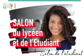
Salon de l'étudiant

En raison de l'annulation de la sortie au salon de l'étudiant le jeudi 18 janvier 2024 suite aux intempéries, le chèque de 12 euros a été rendu aux élèves par les professeurs principaux en heure de vie de classe ce jeudi 1 er février 2024 .