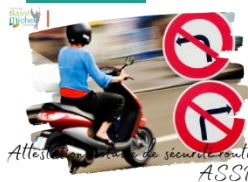
Attestation de sécurité routière ASSR2

Les élèves de 2 o qui n'auraient pas passé l'A.S.S.R.2 l'an dernier ou qui l'auraient ratée sont priés d'en informer Mme NOWAK par mail via École Directe au plus vite pour qu'elle puisse les y inscrire.