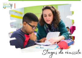
Stages de réussite

Comme pour les vacances de Toussaint, un stage de la réussite sera proposé aux élèves de collège les lundi 26 et mardi 27 février 2024 dans les matières suivantes : anglais, français et mathématiques.