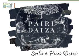
Sortie à Pairi Daiza

Une sortie scolaire à Pairi Daiza aura lieu le vendredi 24 mai 2024 de 08h40 à 19h00 pour les élèves de 5 e dans le cadre de notre projet d'établissement et de son axe sur l'environnement.