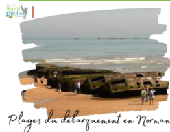
Plages du débarquement en Normandie

Le 3 ème chèque remis pour le séjour en Normandie prévu du lundi 10 au mercredi 12 juin 2024 sera prélevé le mardi 13 février 2024 . Pour rappel, il est d'un montant de 100 euros.