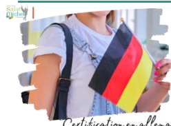
Certification en allemand

L'épreuve de la certification en allemand pour les élèves de 2 o aura lieu à St Michel le mercredi 13 mars 2024 de 08h30 à 12h00 en permanence 4 pour les épreuves écrites et le lundi 19 février en salle 220 pour l'épreuve orale de 15 mn. Une convocation vous sera envoyée avec les dates et les horaires des épreuves.