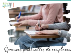
Épreuves ponctuelles de remplacement

Dans le cadre de la mise en place du contrôle continu dans les épreuves du baccalauréat, une convocation aux épreuves ponctuelles de remplacement sera adressée la semaine prochaine aux familles des élèves dont la moyenne est jugée « non significative » par les enseignants via la messagerie École Directe .