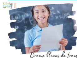
Oraux blancs de français

Pour rappel, la deuxième série d'oraux blancs de français se déroulera du mardi 21 au vendredi 24 mai 2024 .