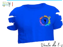
Vente de t-shirt

Une vente de T-shirts est proposée aux élèves internes. Celui-ci sera de couleur bleue avec le logo de l'internat et au dos le prénom de l'élève, le prix est de 10 euros.