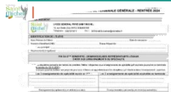
Choix des enseignements de spécialité poursuivis en classe de T°

La législation en vigueur concernant les épreuves du baccalauréat impose qu'un élève abandonne en fin de 1° l'un des trois enseignements de spécialité qu'il/elle suit actuellement.