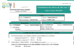
Fiches d'orientation 2° vers 1°

Les élèves de 2° ont reçu le vendredi 19 avril 2024 une fiche d'orientation pour l'année scolaire prochaine.