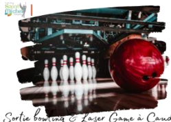
Sortie bowling & Laser Game à Caudry

Un coupon pour une sortie bowling pour les collégiens, et laser Game pour les lycéens le jeudi 23 mai 2024 a été distribué aux élèves pensionnaires.