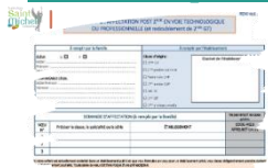
Affectation post 2°