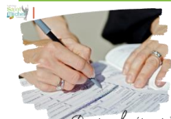
Dossiers de réinscription

Les dossiers de réinscription ont été remis aux élèves de 6° et de 5°.