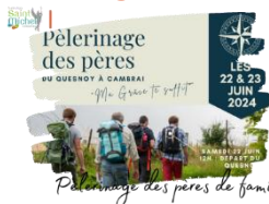
Pèlerinage des pères de famille