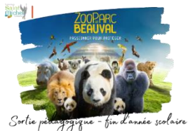
Sortie pédagogique - fin d'année scolaire

Non-participants au séjour : Les cours sont maintenus pour les élèves qui ne participent pas au séjour à Cheverny et Beauval. Quelques modifications ont parfois été apportées aux emplois du temps des élèves afin d'assurer une prise en charge. Il y aura aussi quelques regroupements de classes. Les précisions seront affichées dans la vitrine du niveau 4°.