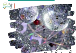
Bal de fin d'année

Comme vous le savez, le bal des T° approche à grand pas.