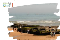
Plages du débarquement en Normandie

Non-participants au séjour - Période du lundi 10 au mercredi 12 juin à St Michel : Les élèves qui ne participent pas au séjour en Normandie seront répartis en deux groupes avec des emplois du temps distincts qui ont été envoyés aux familles via la messagerie École Directe le mercredi 05 juin 2024 . Les élèves devront donc se munir de leur matériel de cours ( cahiers & livres ) ainsi que de leurs fiches de révisions.