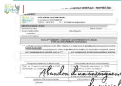
Abandon d'un enseignement de spécialité

Dans le cadre de la réforme du baccalauréat, les élèves de 1° sont amenés à choisir un des trois enseignements de spécialité qui sera uniquement suivi cette année.