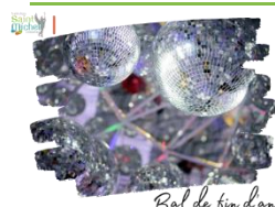
Bal de fin d'année

La fin d'année approchant, des élèves de 3° ont décidé d'organiser un bal pour leurs camarades de 3° afin qu'ils puissent célébrer la fin de l'année, et ainsi passer une dernière soirée tous ensemble! Cette soirée aura lieu le mardi 02 juillet 2024, dans la salle des sports de St Michel, de 18h00 à 22h00 . La somme de 5 euros sera demandée à chaque participant, cette somme leur permettra de consommer les denrées qu'ils ont sélectionnées lors du sondage effectué durant la dernière heure de vie de classe.