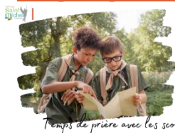
Temps de prière avec les scouts

Les jeunes scouts de toutes les branches sont invités à participer au temps de prière du jeudi 20 juin 2024 à 15h20 AVEC LEUR FOULARD.