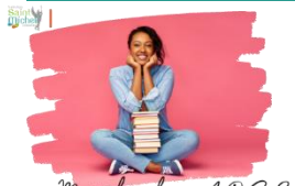
Manuels scolaires A.R.B.S.

Afin de bénéficier de vos manuels scolaires, il est impératif de faire votre inscription sur le site A.R.B.S. : www.arbs.com