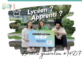
La carte génération #HDF