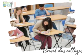
Brevet des collèges

Les épreuves du brevet des collèges se dérouleront les lundi 1 er et mardi 02 juillet 2024 , selon les horaires suivants :