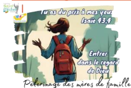
Pèlerinage des mères de famille

La Pastorale des Familles propose les samedi 28 et dimanche 29 septembre 2024 le pèlerinage des mères de famille sur le thème « Tu as du prix à mes yeux » (Isaïe, 43,4).