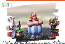
Sortie de fin d'année au parc Astérix

Des paniers pique-nique seront distribués aux élèves demi-pensionnaires et internes participant à la sortie au parc Astérix à leur arrivée à Saint Michel (en salle de restauration collège ou lycée selon le cas) le vendredi 05 juillet 2024 à 07h00 . Il est conseillé aux élèves de prévoir un bloc réfrigéré pour le conserver dans leurs sacs en attendant de se restaurer.