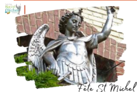
Fête St Michel

En raison des activités mises en place le vendredi 27 septembre , les libérations accordées pour l'après-midi sont suspendues.