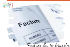
Facture du 1 er trimestre

Vous avez reçu par École Directe votre facture du 1 er trimestre.