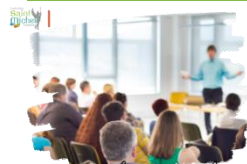
Réunion d'information de rentrée

Le diaporama présenté aux parents présents le jeudi 12 septembre sera visionné par les élèves de 3 ème en heure de vie de classe et envoyé ensuite par mail via École Directe aux élèves et aux familles.