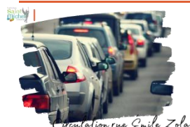
Circulation rue Emile Zola

Pour la sécurité de tous (élèves, adultes), nous vous rappelons que la circulation de véhicules dans la rue Émile Zola est réglementée sur les temps d'arrivée et de départ des bus (cf. panneaux d'interdiction situés en bas de la rue et à l'entrée de chacune des petites rues perpendiculaires à la rue Émile Zola).