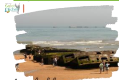
Plages du débarquement en Normandie

Il reste des places pour cette sortie dont le programme figurait dans le St Michel n°1. Les retardataires sont invités à rendre le coupon de toute urgence, accompagné du chèque d'engagement.