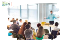
Réunion d'information de rentrée

La réunion d'information 5 ème et 4 ème se déroulera le jeudi 19 septembre à partir de 18h15 à la chapelle puis en salle de classe.