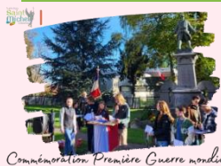
Commémoration Première Guerre mondiale

En raison de la commémoration de l'Armistice de la Première Guerre mondiale, les élèves de 3 ème et ceux de 4 ème de l'atelier défense et citoyenneté, n'auront pas cours le vendredi 8 novembre de 10h45 à 11h40 . En effet, ils participeront à une cérémonie mémorielle au monument aux morts de Solesmes en présence de la municipalité et des différentes écoles de Solesmes. De ce fait, la récréation sera décalée de 10h20 à 10h35 pour ces élèves. À l'appel micro de 10h35 , il sera demandé aux élèves de se ranger dans les rangs habituels afin de pouvoir partir à l'heure.