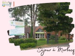
Séjour à Morbecque

Emploi du temps aménagé : pour les élèves qui ne participent pas au séjour à Morbecque du mercredi 16 au vendredi 18 octobre , les cours seront maintenus. Des modifications ont été apportées aux emplois du temps habituels des élèves afin d'assurer une prise en charge. Il y a aussi un regroupement de classes. L'emploi du temps a été remis à votre enfant en heure de vie de classe, et vous a été transmis également via École Directe .