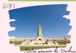
Sortie mémoire de Verdun

Dans le cadre des cours d'histoire, une sortie pédagogique et mémorielle est proposée à l'ensemble des élèves de 3 ème sur le thème « combattre à Verdun en 1916 ». Cette sortie s'intègre au programme d'histoire et géographie de la classe de 3 ème et également à l'EPI sur le devoir de mémoire.