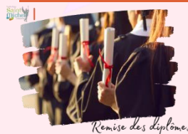
Remise des diplômes

La cérémonie de remise des diplômes du brevet des collèges et du baccalauréat se déroulera le vendredi 8 novembre :