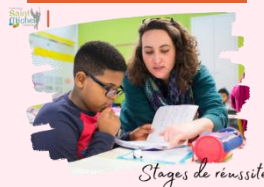
Stages de réussite

Des stages de réussite sont prévus durant la première semaine des vacances de Toussaint, les lundi 21 et mardi 22 octobre . Ils permettront d'apporter une aide aux élèves qui éprouvent des difficultés en ce début d'année scolaire.