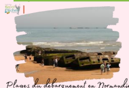
Plages du débarquement en Normandie

Certains élèves n'ont à ce jour pas remis les 4 chèques demandés et/ou la fiche sanitaire de liaison distribuée la semaine dernière. Pour une bonne gestion de ce projet, merci de régulariser la situation de votre enfant.