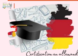
Certification en allemand

La remise des certifications du Goethe Gymnasium se déroulera le mardi 15 octobre à la récréation de 10h30 en salle de conseils ( attendre à l'accueil ) en présence de Mme Bernier et de Mme Lencel qui ont assuré la préparation de l'examen.