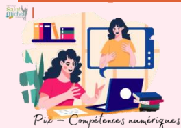
Pix – Compétences numériques

Pour rappel, les élèves de collège et de lycée ont une certification à passer.