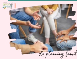
Le planning familial

Depuis 2001 , l'éducation à la sexualité est obligatoire dans les écoles, les collèges et les lycées. L'éducation à la sexualité en milieu scolaire contribue à développer chez les élèves le respect de soi, de l'autre et l'acceptation des différences. Cette éducation intègre une réflexion sur les dimensions affectives, culturelles et éthiques de la sexualité. Elle est cruciale pour accompagner les jeunes dans leur vie affective et favoriser leur santé sexuelle.