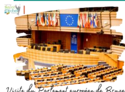
Visite du Parlement européen de Bruxelles

Dans le cadre des cours d'HGGSP, une sortie pédagogique est proposée aux élèves de 1 ère et T o de la spécialité HGGSP ( ainsi qu'aux élèves de 1 ère et Tle non spécialistes dans la limite des places disponibles ) au Parlement européen de Bruxelles.