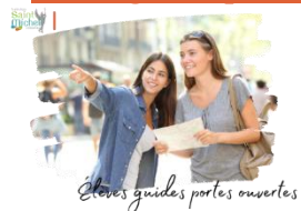
Elèves guides portes ouvertes

Nous faisons appel à nos élèves collégiens et lycéens afin de guider les parents lors de notre journée « portes ouvertes » du samedi 7 décembre de 9h00 à 13h00.