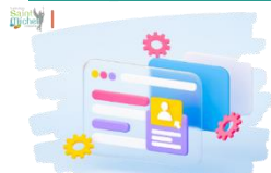
Inscription aux épreuves du baccalauréat

Dans le cadre de la réforme du baccalauréat, la création d'un compte candidat devient obligatoire pour chaque élève. Chaque élève de 1 ère doit ainsi accéder à son « portail candidat » pour vérifier et valider son inscription aux épreuves anticipées du baccalauréat sur le site « Cyclades » ( https://cyclades.education.gouv.fr/cyccandidat/portal/login ) à partir des identifiants de connexion remis par l'établissement. C'est également à partir de cet espace que les élèves trouveront les documents suivants : récapitulatifs d'inscription, notification