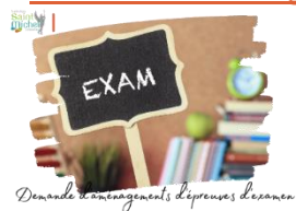
Demande d'aménagements dispensés de l'examen

La circulaire relative aux demandes d'aménagements a été reçue.