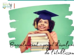
Baccalauréat - projet d'évaluation de l'établissement

Depuis la session 2022 du baccalauréat, le contrôle continu représente 40% tandis que les épreuves anticipées et les épreuves terminales représentent 60% de la note globale. Cela amène l'équipe pédagogique, sous la responsabilité du chef d'établissement, à élaborer un cadre réfléchi et organisé pour l'évaluation des élèves au cours du cycle terminal ( classes de 1 ère et de Tle ) au travers d'un projet d'évaluation qui permettra de rendre explicites les pratiques d'évaluation, de donner sens à ce qui est mis en œuvre et d'en partager les principes avec les élèves et leurs familles.