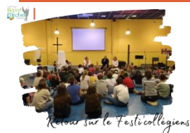
Retour sur le Festi'collégiens

Nous avons participé au festi'collégiens pendant les vacances de Toussaint sur le thème « Dieu, la terre, les autres ... et moi ! ». Des chants, des chorés, des jeux, de l'observation dans la nature, des temps de réflexion et de partage, une veillée incroyable dans la chapelle de la Maison du Diocèse à Raismes où nous avons découvert l'adoration eucharistique, la possibilité de recevoir le Sacrement de réconciliation, et une nuit un peu ... courte, voilà notre programme !