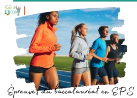
Épreuves du baccalauréat en EPS

Évaluations de l'enseignement de l'EPS au baccalauréat général. Enseignement obligatoire en cours de formation (CCF).