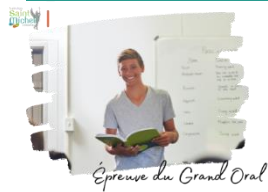
Épreuve du Grand Oral

Une présentation des modalités et des critères d'évaluation du Grand Oral a été faite à l'ensemble des élèves de Tle en heure de vie de classe ce vendredi 8 novembre . Des documents d'information élaborés par le ministère ont également été remis aux élèves. Une version numérique a également été envoyée aux familles via la messagerie École Directe ce vendredi 8 novembre . Merci d'en prendre connaissance.