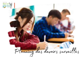
Planning des devoirs surveillés

Les devoirs surveillés se dérouleront en permanence 3 dans les conditions d'examen et la réglementation en vigueur sera appliquée (le matériel nécessaire devra être mis dans une pochette transparente, le prêt de matériel entre élèves et l'utilisation d'objets connectés ne seront pas autorisés).