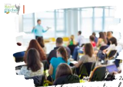
Présentation de la 2 nd e et des enseignements en lycée

Toujours dans le cadre du Parcours Avenir , les élèves de 3 ème et leurs parents sont invités à assister à la présentation du lycée, de la 2 nd e générale et de la réforme du baccalauréat qui se déroulera le jour des portes ouvertes, le samedi 7 décembre à compter de 10h30.