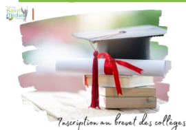
Inscription au brevet des collèges

En vue de l'inscription de votre enfant au brevet des collèges, session juillet 2025 , les familles sont invitées à prendre connaissance de la fiche remise cette semaine à chaque élève de 3 ème .