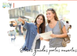
Élèves guides portes ouvertes

Nous faisons appel à nos élèves collégiens et lycéens afin de guider les parents lors de notre journée portes ouvertes du samedi 7 décembre de 9h00 à 13h00 .