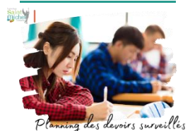
Planning des devoirs surveillés