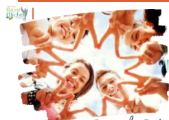
Journée des Fraternités

En raison de la journée des Fraternités qui se déroulera le vendredi 6 décembre , veille de notre journée portes ouvertes, les cours de collège et de lycée se termineront le jeudi 5 décembre à 17h15 et l'internat sera fermé. Les cours reprendront le lundi 9 décembre.