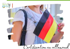
Certification en allemand

Le jeudi 28 novembre , une fiche d'inscription à l'épreuve de certification en allemand a été remise aux élèves germanistes qui se sont inscrits à l'examen et à la préparation en rendant un coupon à Mme Duez. Merci aux parents de vérifier cette fiche (comme cela doit aussi être fait pour la fiche d'inscription au brevet des collèges), de corriger les éventuelles erreurs en rouge, puis de la transmettre, signée, directement à Mme DUEZ, par l'intermédiaire de leur enfant dès le lundi 9 décembre.