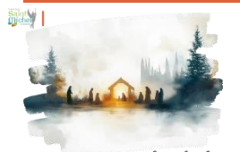
Concours de crèches de Noël

Quelle sera ta crèche ? Invente, crée, imagine ! Seul(e) ou en équipe, avec tes parents ou grand-parents ! Tu choisis tes matériaux, tes dimensions... !