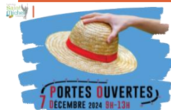
Affiches portes ouvertes

Les enfants dont les parents sont commerçants ou en mesure d'afficher la journée portes ouvertes de St Michel le samedi 7 décembre de 9h00 à 13h00 sont invités à passer dès maintenant à l'accueil pour retirer des affiches publicitaires. Merci à ces familles pour leur coopération.