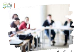
Conseils de classe