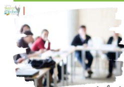
Conseils de classe

À noter : les élèves délégués ont reçu leur invitation. Les parents correspondants ont reçu les informations (le courrier d'invitation, la liste des coordonnées des élèves de la classe et le compte-rendu du conseil de classe à compléter) par mail. L'APEL n'envoie plus de questionnaires aux familles, celles-ci doivent contacter leurs parents-correspondants si elles ont des éléments à leur communiquer.