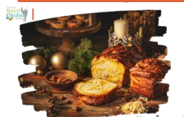
Vente de coquilles de Noël

L'Avent commence ce dimanche ! Le temps des chocolats chauds est revenu !