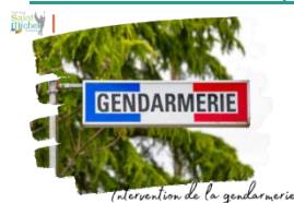
Intervention de la gendarmerie

Pour les sensibiliser à l'utilisation d'internet et à ses potentielles dérives, les élèves de 2 nde assisteront le mardi 10 décembre de 13h20 à 14h15 , à une intervention de la gendarmerie dans les salles 001, 002 et 003.