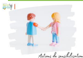
Actions de sensibilisation

Les élèves de 3 ème assisteront le mardi 10 décembre à une action de sensibilisation sur le thème du « consentement » pilotée par la gendarmerie.