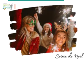
Soirée de Noël