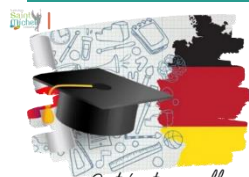
Certification en allemand

L'épreuve de la certification en allemand pour les élèves de 2 nde et de 1 ère aura lieu à St Michel le mercredi 12 mars de 8h30 à 12h en salle 101 pour les épreuves écrites et le lundi 17 mars en salle 114 pour l'épreuve orale de 15 mn.