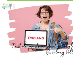
Test de positionnement en anglais Ev@lang Collège

Voici les dates du test de positionnement en anglais, obligatoire pour tous les élèves de 3 ème :