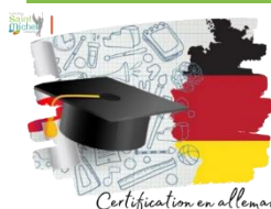
Certification en allemand

L'épreuve de certification en allemand du Goethe Institut pour les élèves de 3 ème aura lieu à St Michel le mercredi 12 mars de 8h30 à 12h en salle 101 (bâtiment lycée) pour les épreuves écrites et le lundi 17 mars dans la matinée en salle 114 (près du bureau de Mme Duez) pour l'épreuve orale de 15 mn.