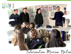
Intervention Marine Nationale