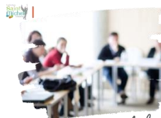
Conseils de classe