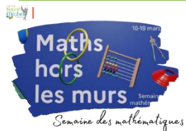
Semaine des mathématiques

Comme chaque année, la semaine des mathématiques se tient la semaine du vendredi 14 mars (notamment pour célébrer la journée du nombre pi) ; 3.14 : la date, qui s'écrit 3.14 en anglais, est l'occasion de célébrer la constante d'Archimède utilisée pour calculer la circonférence d'un cercle. La semaine des mathématiques a pour objectif de montrer à tous les élèves ainsi qu'à leurs parents, une image actuelle, vivante et attractive des mathématiques .