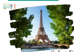
Sortie à Paris

Une sortie pédagogique est organisée pour les élèves de 2 nde à Paris le jeudi 12 juin .