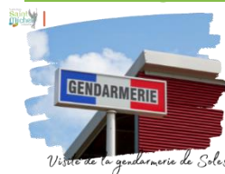
Visite de la gendarmerie de Solesmes

Les élèves de l'atelier défense et citoyenneté ont la possibilité de visiter la gendarmerie de Solesmes le mardi 11 mars de 15h10 à 17h15.