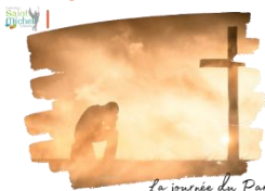
La journée du Pardon

La journée du Pardon se déroulera le jeudi 20 mars . L'ensemble des élèves y a été sensibilisé en classe. Des prêtres de notre doyenné seront présents dans la chapelle pour accueillir les jeunes et leur donner le Sacrement du Pardon. C'est un sacrement qui redit aux chrétiens l'amour immense de Dieu pour chacun. Il permet de déposer devant Dieu tout ce qui alourdit notre vie, de nous ouvrir de nouveaux horizons avec les autres et de nous rapprocher de Dieu.