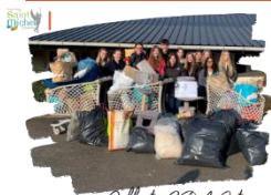
Collecte SDA Estourmel !

Les élèves de Tle , option Grands Enjeux du Monde Contemporain ont récemment organisé une collecte au profit de la SDA d'Estourmel .