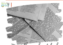
Mise à l'honneur des articles de presse

Dans le cadre de leur spécialité en Sciences Économiques et Sociales ( SES ), les élèves de 1 ère ont eu l'opportunité d'assister à l'intervention du Procureur de la République. Afin de partager cette expérience enrichissante, ils ont rédigé des articles de presse, faisant preuve d'une grande qualité de travail.