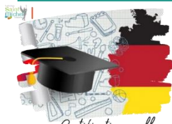
Certification en allemand

Pour rappel, la partie orale des épreuves de certification en langue allemande se déroulera le lundi 17 mars en salle 114 . Les élèves concernés sont tenus d'être en possession de la convocation qui leur a été remise ( également téléchargeable depuis leur compte Cyclades ) ainsi que d'une pièce d'identité.