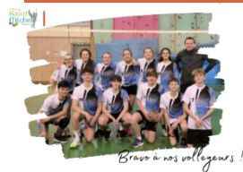
Bravo à nos volleyeurs !

Le saviez-vous ? Il existe une équipe de jeunes incroyables au collège St Michel qui se réunit chaque mardi soir pour des entraînements de volley-ball. Et croyez-moi, ils sont impressionnants, dynamiques, responsables, souriants et déterminés... Bref, un véritable bonheur et un honneur de les entraîner !