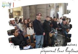
74 jeunes catéchumènes préparant leur baptême

Ce samedi 8 mars , Mgr Dollmann, archevêque de Cambrai, a officiellement appelé les jeunes catéchumènes préparant leur baptême. Ce sont quelque 240 catéchumènes pour notre diocèse, en plus de leurs accompagnateurs ou parrain/marraine, qui se sont rassemblés en la collégiale St Pierre de Douai. Mgr Dollmann a rappelé dans son homélie les différentes étapes du parcours des catéchumènes.