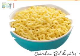
Opération 'Bol de pâtes' !

Pour mettre la famine échec et mat, je participe à 'Bol de pâtes' ! Les chrétiens sont invités à vivre un temps de Jeûne pendant le Carême. Ainsi, le vendredi 28 mars, tous ceux qui le souhaitent , jeunes et adultes, pourront choisir un repas simplement composé d'un bol de pâtes et d'une compote.