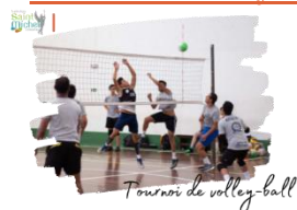
Tournoi de volley-ball

Afin d'aider l'option EPS 1 ère / Tle à financer de futurs projets, nous avons décidé d'organiser un tournoi de volley-ball qui se déroulera le vendredi 28 mars à partir de 17h30 et jusqu'à 20h30 . Il concerne les élèves de tous les niveaux .