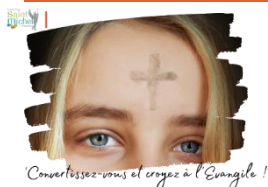
Convertissez-vous et croyez à l'Évangile !

Le vendredi 7 mars , une quarantaine d'élèves volontaires sont venus recevoir les Cendres lors de la célébration qui était proposée à la chapelle le midi.