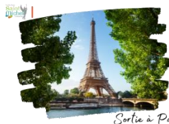
Sortie à Paris

Une sortie pédagogique est organisée pour les élèves de 2 nde à Paris le jeudi 12 juin . Au programme : visite de la Cité de l'économie, pique-nique au jardin de Monceau (fourni par l'établissement pour les élèves internes et 1/2-pensionnaires et apporté par les élèves externes), visites de l'Hôtel Matignon, du musée du Louvre, suivies d'un repas au Mac Donald et d'une croisière en bateau mouche.