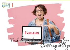
Test de positionnement en anglais Ev@lang Collège

Voici les dates du test de positionnement en anglais, obligatoire pour tous les élèves de 3 ème :