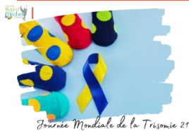
Journée Mondiale de la Trisomie 21