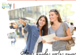
Élèves guides portes ouvertes

Nous faisons appel à nos élèves collégiens et lycéens afin de guider les parents lors de notre journée 'portes ouvertes' du samedi 22 mars de 10h à 13h .