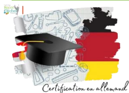
Certification en allemand

L'épreuve de certification en allemand du Goethe Institut pour les élèves de 3 ème a eu lieu le mercredi 12 mars . Le lundi 17 mars dans la matinée se dérouleront les épreuves orales. Elles auront lieu en salle 114 (près du bureau de Mme Duez) et dureront 15 minutes.