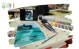
Invitation à l'expo 'La Quête de l'Identité'

Nous avons le plaisir de vous inviter à découvrir l'exposition 'La Quête de l'Identité' , une expérience immersive qui se tiendra le lundi 31 mars pour les élèves de 2 nde , le mardi 1 er avril pour les 1 ères et le mercredi 2 avril pour les Tles, de 9h10 à 10h30, en permanence 4 et dans la salle flexible.