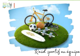
Raid sportif en équipe

Si tu es passionné par la nature et que tu adores le sport, cet événement est fait pour toi ! Les lundi 7 et mardi 8 avril , un RAID sportif en équipe est organisé pour tous les aventuriers en herbe.