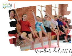
Résultats de l'AS Gym