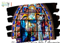
25 mars - l'Eglise fête l'Annonciation

Ce mardi 25 mars , la chapelle a ouvert ses portes aux récréés et le midi afin que les jeunes puissent redécouvrir le vitrail de l'Annonciation.