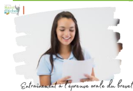
Entraînement à l'épreuve orale du brevet

Les convocations pour l'entraînement à l'épreuve orale du brevet ont été remises aux élèves de 3 ème en heure de vie de classe ( et précédemment pour les élèves qui sont partis au jumelage en Espagne ).