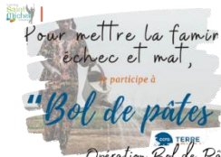
Opération Bol de Pâtes

BRAVO aux 350 jeunes, soit 66% des élèves demi-pensionnaires , qui se sont portés volontaires pour un repas solidaire en ce vendredi 28 mars !