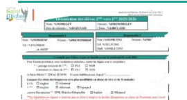
Fiche de vœux 2nde vers 1ere

Une fiche de vœux a été remise à chaque élève de 2 nde ce vendredi 28 mars . Il est demandé aux familles de la compléter et de la signer.