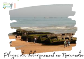
Plages du débarquement en Normandie

Nous vous informons que le prochain chèque de 50 € dont le prélèvement était prévu en mars ( paiement échelonné ) sera encaissé le mardi 1 er avril .