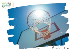
Tournoi de Basketball

Le jeudi 3 avril à 17h30 , le bureau des élèves (BDE) organise un tournoi de basketball. L'inscription est de 5 € par joueur, incluant une boisson et deux croque-monsieur. Les équipes seront composées de 5 à 6 joueurs. Les coupons d'inscription sont à déposer dans la boîte aux lettres du BDE avant le mardi 1 er avril .