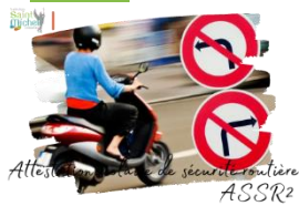
Attestation de sécurité routière ASSR2

Les élèves de 3 ème passeront leur attestation de sécurité routière niveau 2 après les vacances de printemps. Par conséquent, ils sont invités à s'entraîner dès maintenant via l'adresse suivante : https://e-assr.education-securite-routiere.fr/preparer/assr .