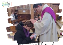
Célébration des scrutins

Ce lundi 24 mars , à la chapelle, quelques élèves ont entouré les jeunes qui préparent leur baptême pour l'étape des scrutins .