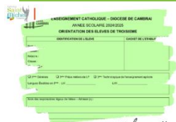
Fiche navette verte

La fiche navette portant, en page 2, l'avis du conseil d'orientation a été remise à chaque élève le vendredi 21 mars . Il reste à la famille à compléter l'encadré 3 et à signer ( pour rappel, la signature des deux parents est obligatoire ).