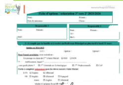
Fiche de vœux 3ème vers 2nde

Une fiche de vœux a été remise à chaque élève de 3 ème le vendredi 21 mars . Il est demandé aux familles de la compléter, de la signer.